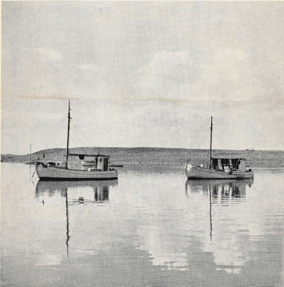
FRA ROSKILDE FJORD

MEDLEMSBLAD FOR FOTOHANDLERFORENINGEN LANDSFORENING