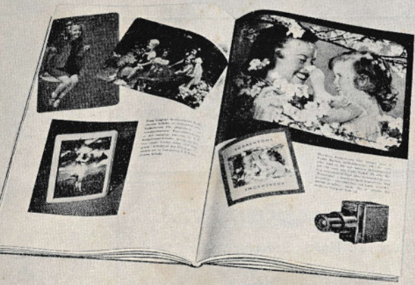
Bogens iøjnefaldende forside og et par opslag, der viser det righoldige billedmateriale